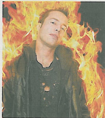
Der niederländische Trance-DJ Sander van Doorn kommt am 21. November erstmals nach Linz.